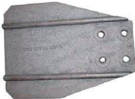
Pos 1, Z 577